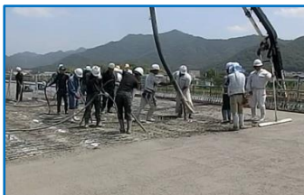
①コンクリート打設